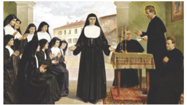
Quadro que representa a primeira profissão das FMA

No dia 5 de agosto, o Instituto das Filhas de Maria Auxiliadora - Irmãs Salesianas completou 147 anos. Surgiu em Mornese, Itália, em 1872, fruto do amor apostólico de Dom Bosco e de Madre Mazzarello que, atentos aos sinais de Deus, souberam responder aos apelos das jovens que precisavam de ajuda. As Irmãs Salesianas, educam para a formação de bons cristãos e honestos cidadãos. Em Barbacena, as Filhas de Maria Auxiliadora dirigem o